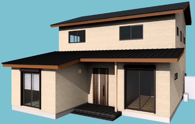
加古川市 T 様邸