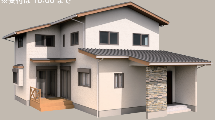
加古川市 O 様邸