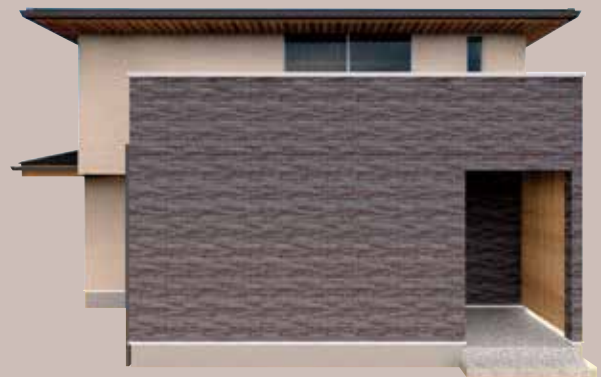
加古川市 ○ 様邸