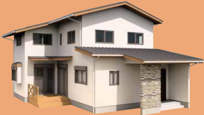
加古川市 ○ 様邸